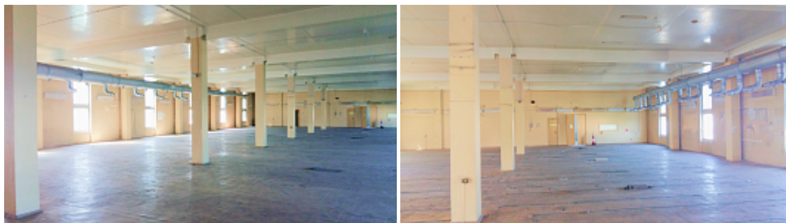
3 этаж Бусиновская Горка ул., д. 11