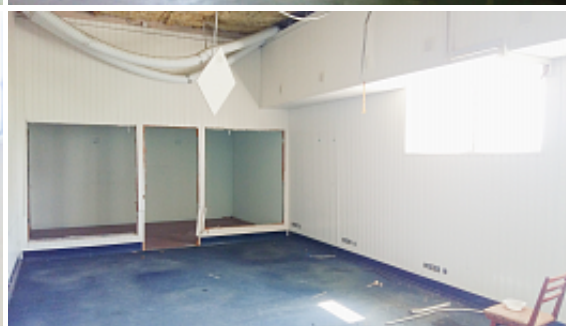
4 этаж Красногвардейский пр., д.26